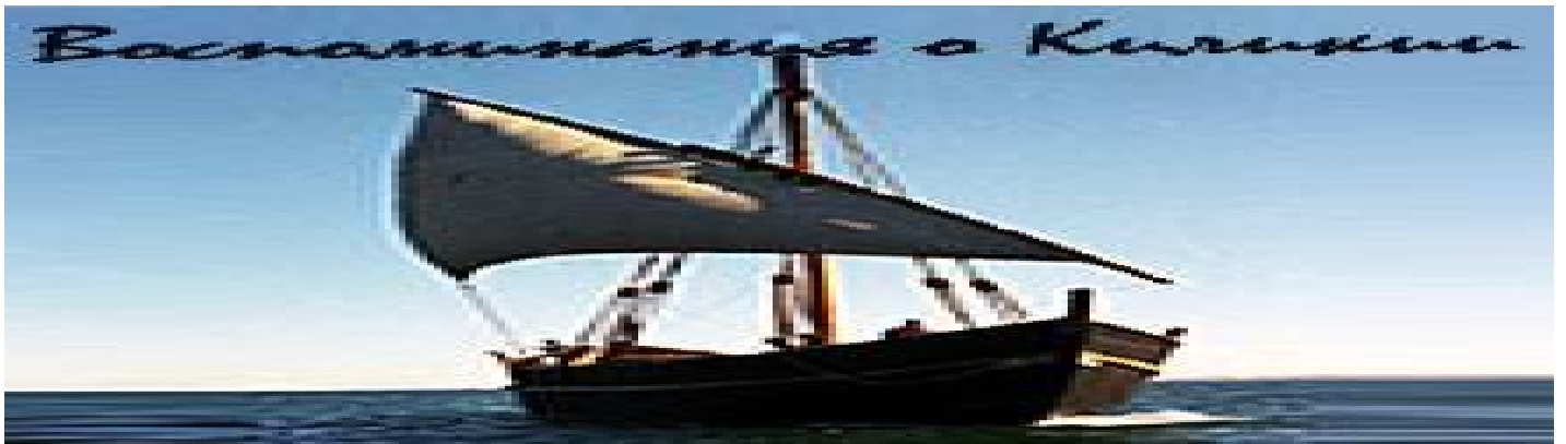
( http://arminfo.info/kilikia/kilikiya.html )

2013 (databydate.php?y=2013) , 2014 (databydate.php?y=2014)