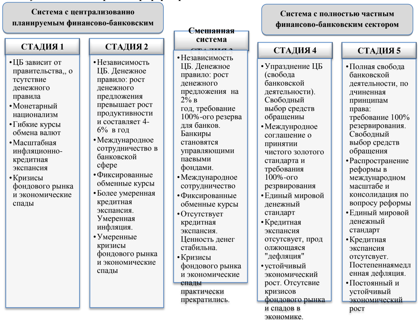
Рисунок 1. Стадии процесса реформирования банковской системы

Источник: Хесус Уэрта де Сото (2008) «Деньги, банковский кредит и экономические циклы», Челябинск: Социум, стр. 564